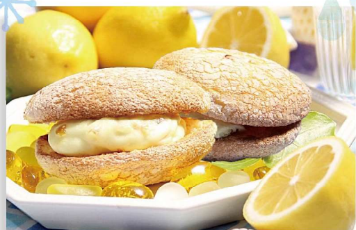
くりむこらしよ(レモン)1個 200円

1年の折り返しにあたる6月、室町時代から宮中では「氷室」から取り寄せた氷を口にし暑気払いを願う行事がありました。いつしか氷は白い三角の外郎に代わり邪気を払うとされる小豆をのせ6月を代表する菓子になりました。