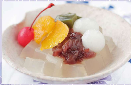
あんみつ 1個 400円

清々しい香気あふれる山形産のよもぎ葉を餡に練り入れました。もっちり、瑞々しい食感の葛饅頭です。