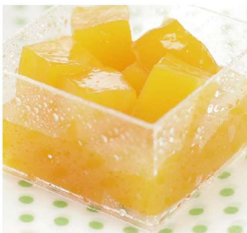
マンゴわらび餅 1個 300円

練切の金魚が泳ぐ水はほんのリレモン風味の寒天です。小豆を小石に見立て涼やかな水辺を表しました。