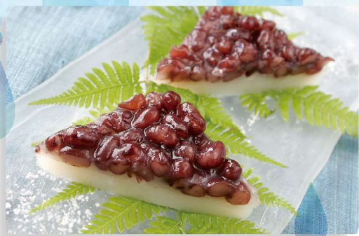
水無月 1個 140円

1年の折り返しにあたる6月、室町時代から宮中では「氷室」から取り寄せた氷を口にし暑気払いを願う行事がありました。いつしか氷は白い三角の外郎に代わり邪気を払うとされる小豆をのせ6月を代表する菓子になりました。