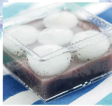
白玉ぜんざい 1個 300円

十勝産の小豆を柔らかく炊き上げました。小豆の風味が生きた冷やして美味しいぜんざいです。つるりとした白玉が涼を誘います。