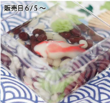
金魚羹 1個 380円

練切の金魚が泳ぐ水はほんのリレモン風味の寒天です。小豆を小石に見立て涼やかな水辺を表しました。