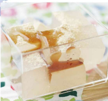
わらび餅 1個 260円

マンゴのピューレを加えたわらび餅。ぷるんとした食感の後に広がる甘酸っぱさ、フルーティーな後味も爽やかなトロピカルな和菓子です。