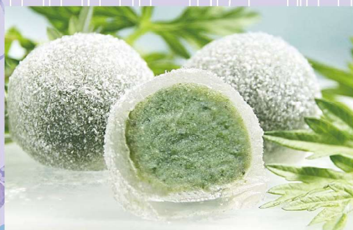
夏よもぎ 1袋(6個入) 500円