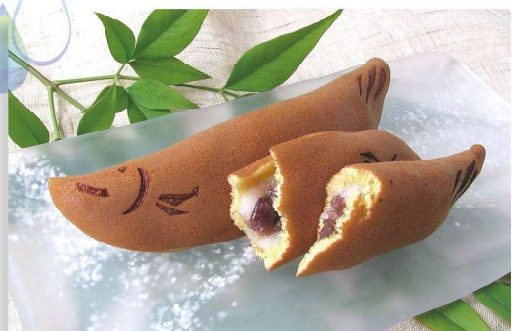
若鮎 1個 160円

ふっくら焼き上げた生地にはレモンピールを入れた「キュッ!」とすっぱいレモンクリーム。たっぷりクリームをサンドした食べ応えのある大きなブッセです。