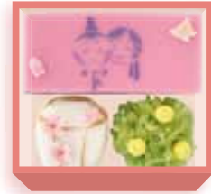
雛祭り (羊羹・煉切・羽二重餅) 1,400円(税込1,512円) 5日前迄に要予約 浅箱 お日保4日 受注期2~4月