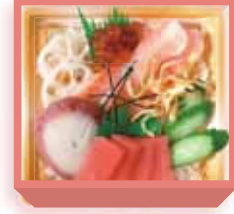
お寿司菓子 1,400円(税込1,512円) 1週間前迄に要予約 浅箱 お日保4日