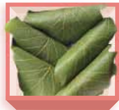
柏餅 (5個人) 1,310円(税込1,414円) 浅箱 お日保本日中 受注期4~5月