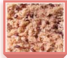
赤飯・大 (410g×2人) 1,720円(税込1,857円) 深箱 お日保4日