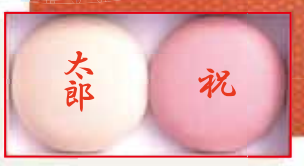
一升背負餅(丸形) 3,620円(税込3,909円) (箱寸340×175高さ55cm)