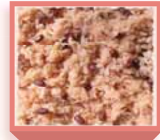
赤飯・小 (410g入り) 990円(税込1,069円) 浅箱 お日保4日

赤飯は日保ちがするように密閉包装(脱酸素剤)してあります。電子レンジ等で加熱して頂く事により出来たての美味しさをお召し上がり頂けます。保存料等は一切使用していません。