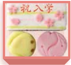
入学祝 (羊羹・煉切・羽二重餅) 1,400円(税込1,512円) 浅箱 お日保4日 受注期3~4月