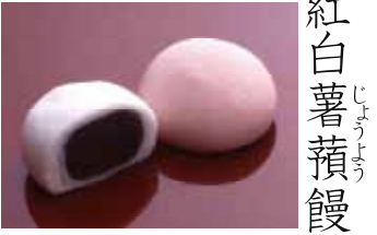
紅白薯蕷饅頭 こし餡に、しっとりした薯蕷生地が上品です。 お日保本日中

6個入 1,080円(税込1,166円) (箱寸185×125 高さ45mm) 9個入 1,610円(税込1,738円) (箱寸187×187 高さ45mm) 12個入 2,160円(税込2,332円) (箱寸250×187 高さ45mm)