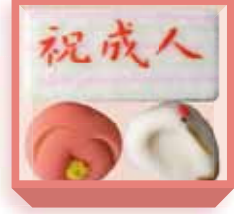
成人式 (羊羹・煉切・羽二重餅) 1,400円(税込1,512円) 5日前迄に要予約 浅箱 お日保4日 受注期1月