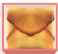
福包み 1,960円(税込2,116円) 深箱 お日保2週間

◆「玉手箱」は、お好みやご用途に合わせてお選びください。 ◆1段、2段、3段とご自由に重ねて頂きます。 ◆本紙に掲載の慶用菓子類は全てご予約販売です。表記の無い商品は、3日前までご予約ください。