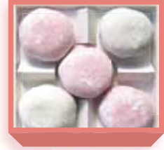
紅白大福 (粒餡入り杵搗大福) 1,010円(税込1,090円) 浅箱 お日保4日