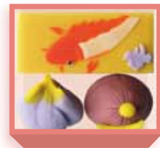
端午の節句 (羊羹・煉切) 1,400円(税込1,512円) 5日前迄に要予約 浅箱 お日保4日 受注期4~6月