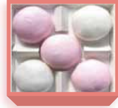
紅白饅頭 (漉餡入り薯蕷饅頭) 1,110円(税込1,198円) 浅箱 お日保4日