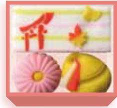
七五三 (羊羹・煉切) 1,400円(税込1,512円) 5日前迄に要予約 浅箱 お日保4日 受注期10~11月