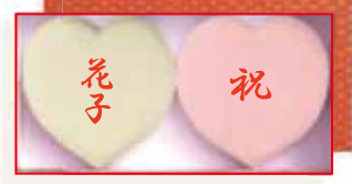
一升背負餅(ハート形) 4,020円(税込4,341円) (箱寸340×175高さ55cm)