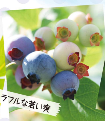
カラフルな若い実