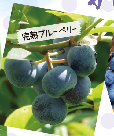
完熟ブルーベリー