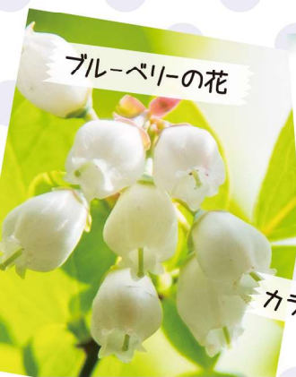
ブルーベリーの花