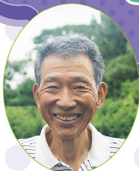
ブルーベリー生産者 焼津市 木内農園さん