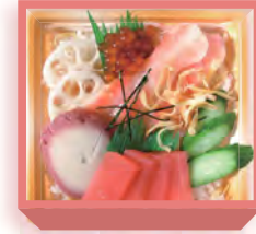
お寿司菓子 1,440円(税込1,555円) 1週間前迄に要予約 浅箱 お日保4日