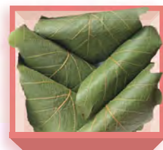
柏餅(5個入) 1,310円(税込1,414円) 浅箱 お日保本日中 受注期4~5月