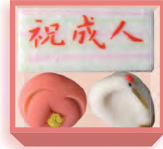
成人式(羊羹・煉切・羽二重餅) 1,440円(税込1,555円) 5日前迄に要予約 浅箱 お日保4日 受注期1月