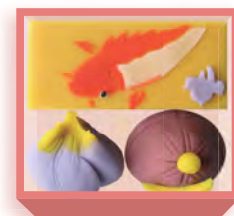
端午の節句(羊羹・煉切) 1,440円(税込1,555円) 5日前迄に要予約 浅箱 お日保4日 受注期4~6月