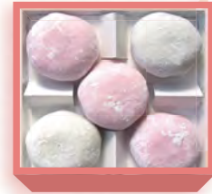
紅白大福(粒餡入り杵搗大福) 1,040円(税込1,123円) 浅箱 お日保4日