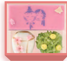
雛祭り(羊羹・煉切・羽二重餅) 1,440円(税込1,555円) 5日前迄に要予約 浅箱 お日保4日 受注期2~4月