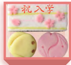
入学祝(羊羹・煉切・羽二重餅) 1,440円(税込1,555円) 浅箱 お日保4日 受注期3~4月