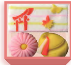
七五三(羊羹・煉切) 1,440円(税込1,555円) 5日前迄に要予約 浅箱 お日保4日 受注期10~11月