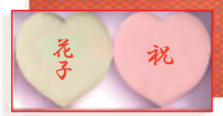
一升背負餅(ハート形) 4,220円(税込4,557円) (箱寸340×175高さ55cm) お名前お入れします お日保本日中