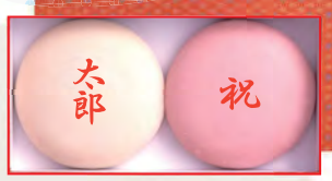
一升背負餅(丸形) 3,820円(税込4,125円) (箱寸340×175高さ55cm) お名前お入れします お日保本日中