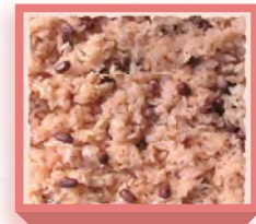
赤飯・大(410g×2入) 1,820円(税込1,965円) 深箱 お日保4日