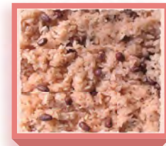
赤飯・小(410g入り) 1,040円(税込1,123円) 浅箱 お日保4日

赤飯は日保ちがするように密閉包装(脱酸素剤)してあります。電子レンジ等で加熱して頂く事により出来たての美味しさをお召し上がり頂けます。保存料等は一切使用していません。