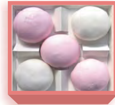
紅白饅頭(漉餡入り薯蕷饅頭) 1,140円(税込1,231円) 浅箱 お日保4日